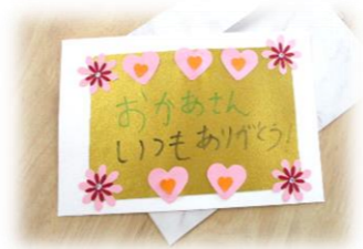
母の日に合わせた 手作りカード。

見本を参考にパーツを重ね合わせたり、向きを変えて みたりと、イメージをふくらませて…。