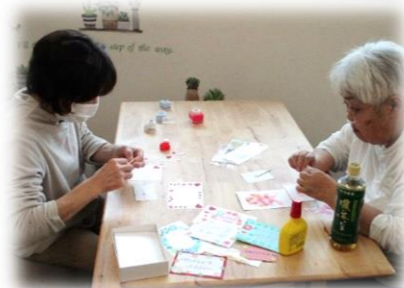
思いのこもった、色とりどりのメッセージカードが できました。